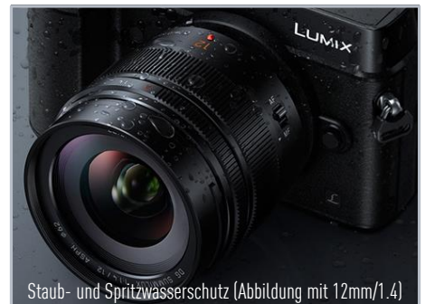
Staub- und Spritzwasserschutz (Abbildung mit 12mm/1.4)