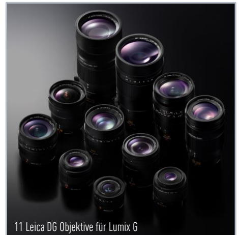
11 Leica DG Objektive für Lumix G

Leica DG Summilux Qualität – hohe Auflösung und cremiges Bokeh Extrem Lichtstark F1.4 – hohe Freistellung und perfekt für LowLight Wetterfestigkeit – Staub- und Spritzwasserschutz Vielseitige Einsatzmöglichkeiten – 25mm (KB: 50mm) Brennweite Objektivkonstruktion – 9 Linsen in 7 Gruppen (2 asph., 1 UHR Linse) Kompakte Abmessungen – Ø 6,3 x 5,5 cm; Gewicht: 205g